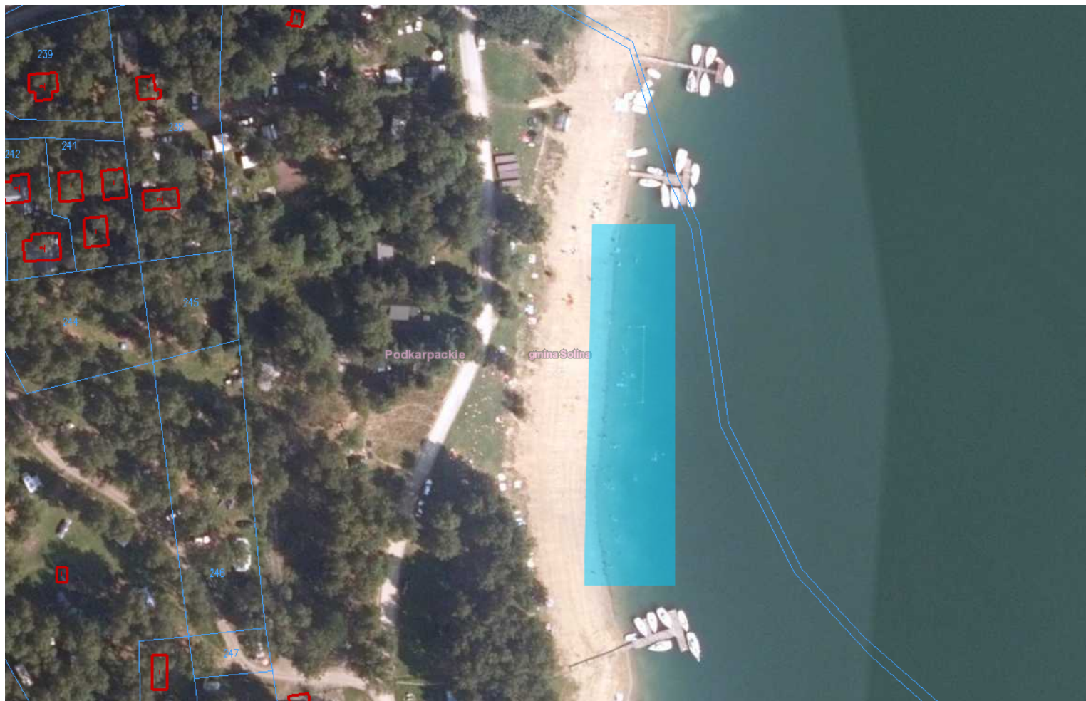
Kąpielisko - Patelnia w Polańczyku (do 100 m)

Załącznik Nr 3 do uchwały Nr ..... Rady Gminy Solina z dnia.....2019 r.