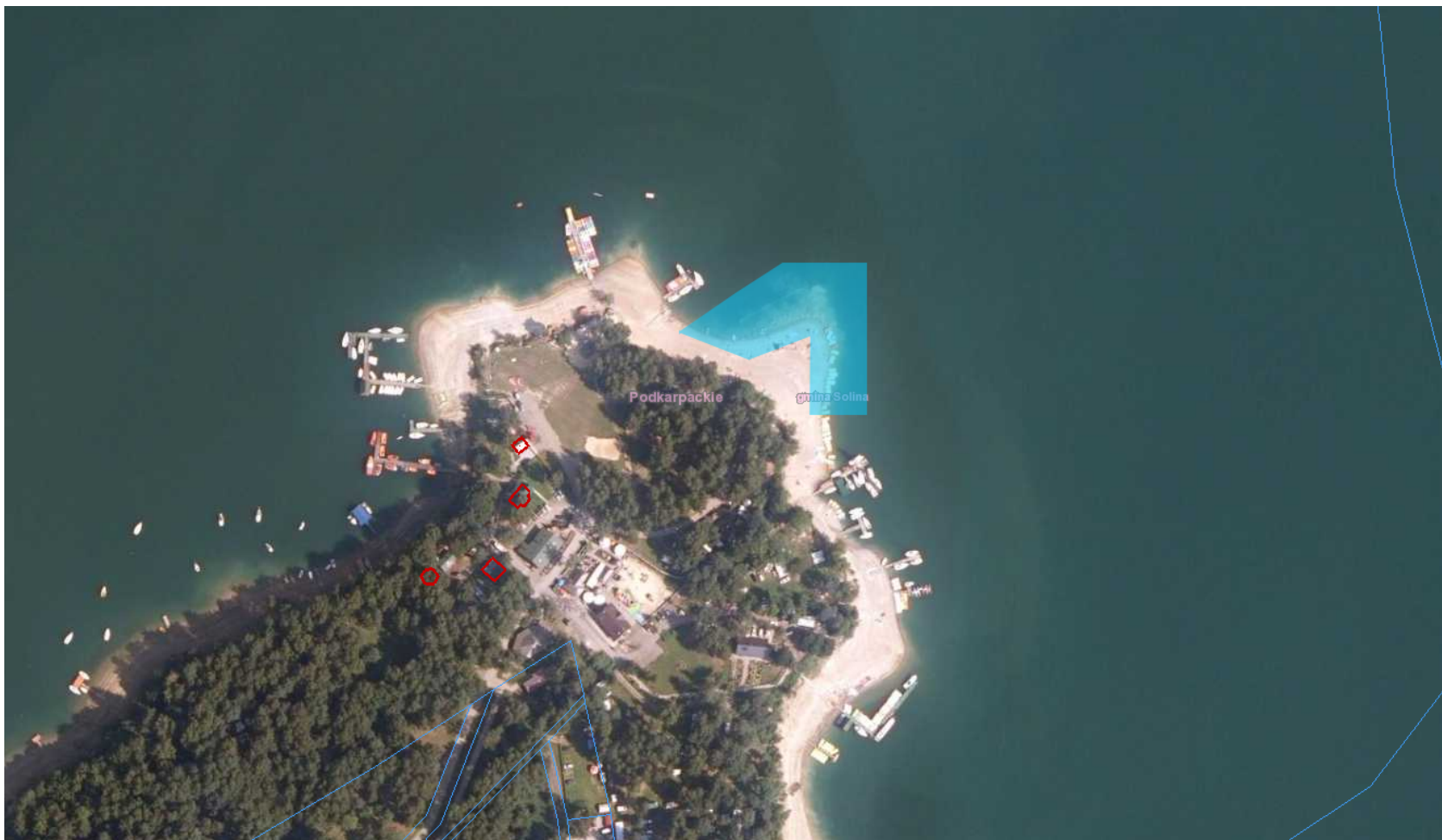
Kąpielisko - Cypel w Polańczyku (do 100 m)

Załącznik Nr 1 do uchwały Nr ..... Rady Gminy Solina z dnia.....2019 r.