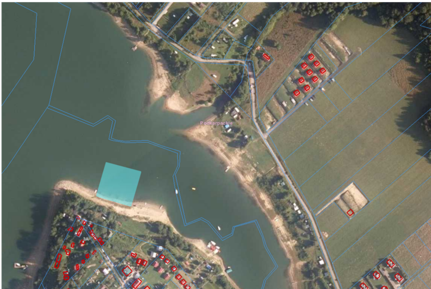
Miejsce wykorzystywane do kąpieli - Zielona plaża w miejscowości Zawóz (dz. nr. 45/1)

Załącznik Nr 5 do uchwały Nr ..... Rady Gminy Solina z dnia.....2019 r.