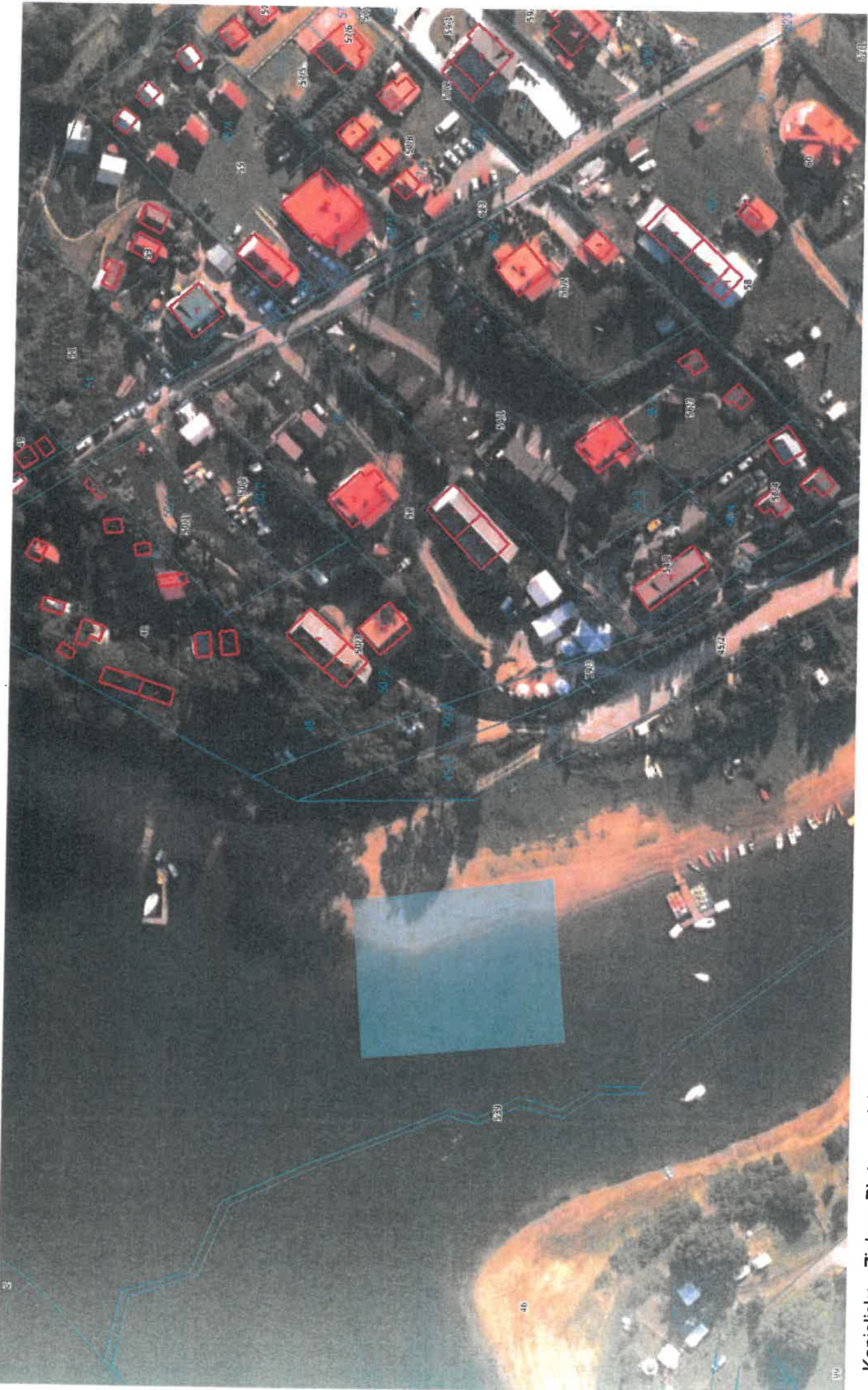
Kąpielisko - Zielona Plaża w miejscowości Zawóz (dz. nr. 45/1) 50 m