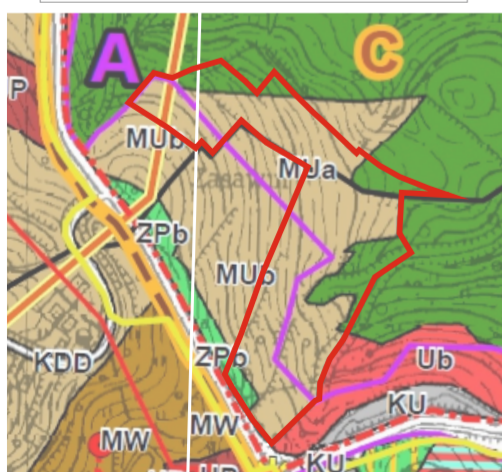
Fragment rysunku Studium Uwarunkowań i Kierunków Zagospodarowania Przestrzennego Gminy Solina

STAROSTA LESKI POWIATOWY OŚRODEK DOKUMENTACJI GEODEZYJNEJ I KARTOGRAFICZNEJ w Lesku