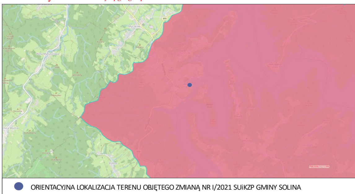
Tab. 3A. Charakterystyka JCWP RWr o nazwie „Zb. Solina”. /Źródło: karty.apgw.gov.pl:4200/

Ryc. 1. Orientacyjne położenie terenu objętego sporządzeniem Zmiany Nr I/2021 SUIKZP Gminy Solina w odniesieniu do Jednolitych Części Wód Powierzchniowych Zbiornikowych. /Źródło: karty.apgw.gov.pl:4200/